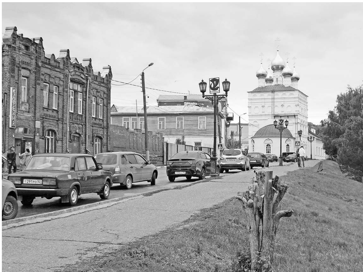
Вдали - Воскресенская церковь.